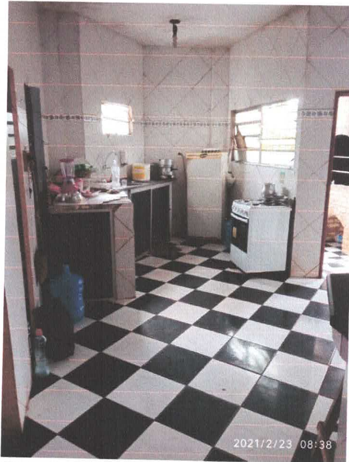
Figura 5 Copa e cozinha.

2.4.1. Piso: é constituído em lajotas cerâmica sendo que todas as peças são iguais e encontram-se em regular estado. Piso bastante conservado e em bom estado.