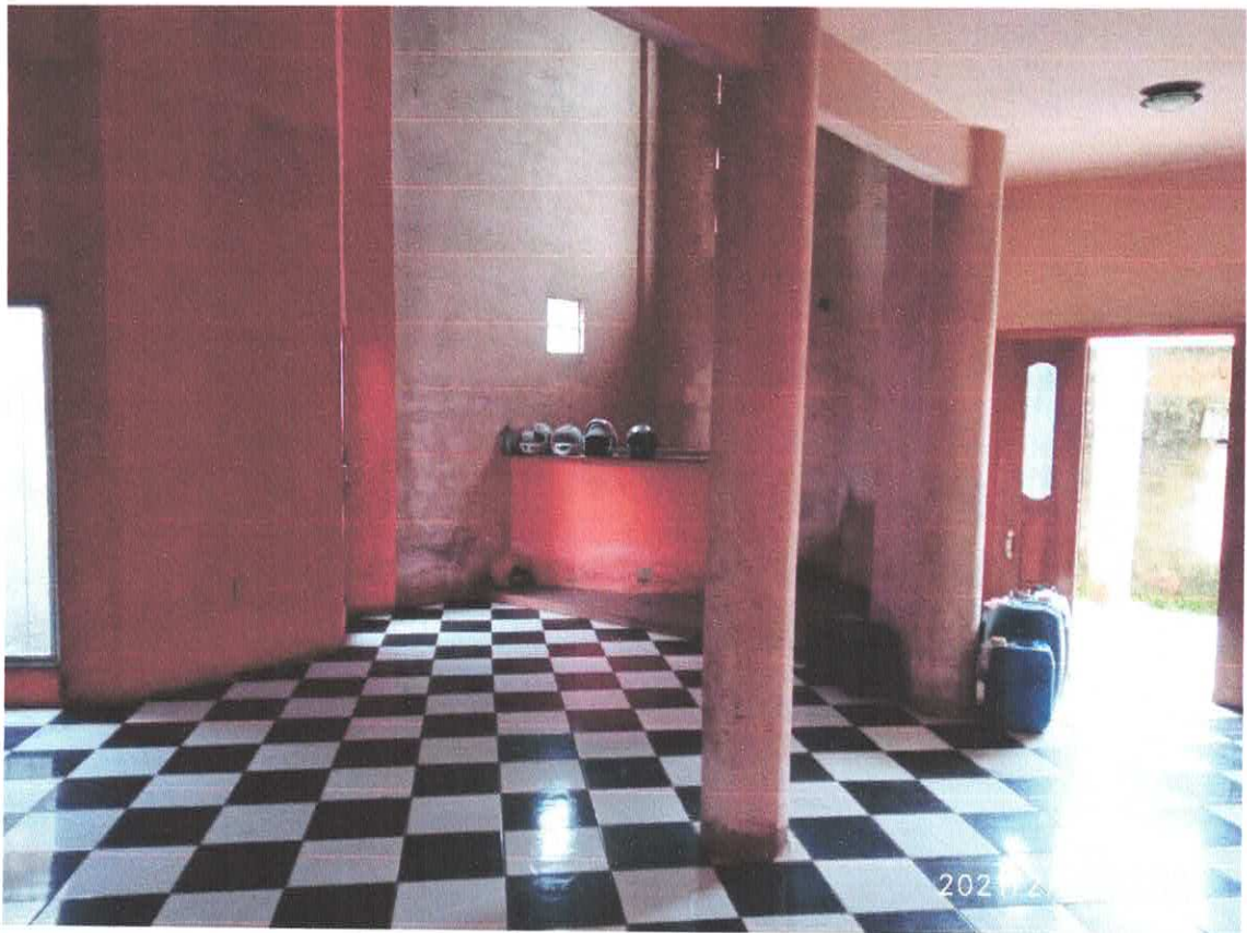
Figura 2 Sala estar

2.1.1. Portas e gradis: Com acesso por porta de madeira maciça com folha fixa e bandeira com folha de abrir e visor de vidro, trabalhada e de ótima qualidade. A porta é acabada com verniz brilhante, necessitando de retoques, A porta