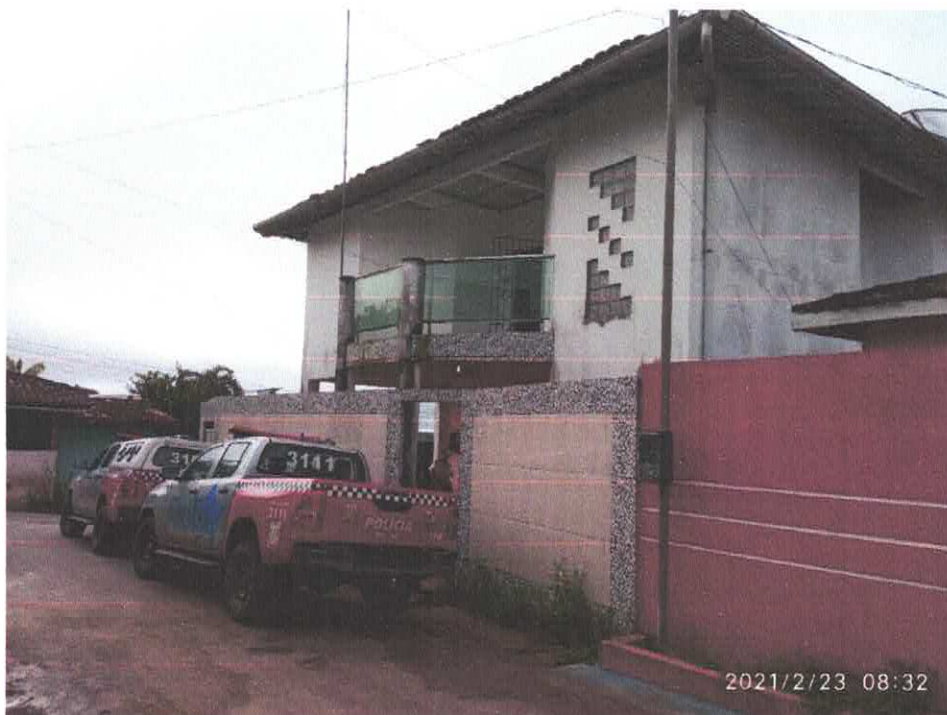
Figura 1 Fachada

Condições: A fachada construída em alvenaria, delimitada por muro em alvenaria acabado com revestimento cerâmico, pintura externa realizada em tinta acrílica fosca branca, apresenta sinais de umidade, necessitando de