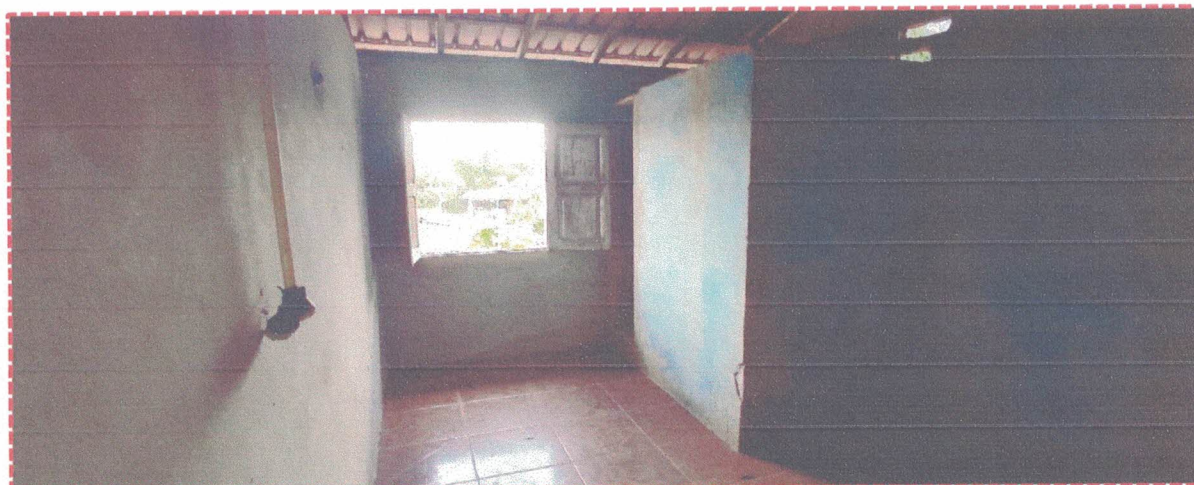
Figura 3: suite